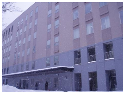
人文・社会科学総合教育研究棟 (南側)

西5丁目の通り(北大通)から、北大正門(北9条西5丁目)へお入りください。正門からそのまま西に向かって進むと、ロータリーに突き当たりますので、右に曲がり北に向かって進んでください。右手に経済学部、法学部、スラブ研究所の看板を通り過ぎると、人文・社会科学総合教育研究棟の正面入口が見えてきます。