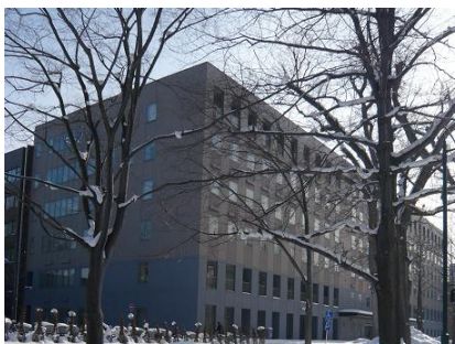
人文・社会科学総合教育研究棟 (北側)

12条駅を出て、北に向かい、最初の信号を左(西)に曲がります。すると北大13条門(北13西4)が見えます。13条門からそのまま西に向かって進むと、約350mで工学部に突き当たりますので、左に曲がって南に進んでください。左手に教育学部、文学部の看板を通り過ぎると、人文・社会科学総合教育研究棟の正面入口が見えてきます。