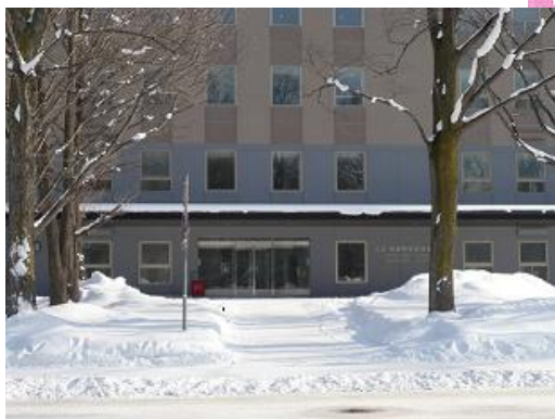
人文・社会科学総合教育研究棟 正面入口